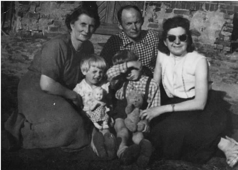
Rysunek 3. Opowieść rodzinna