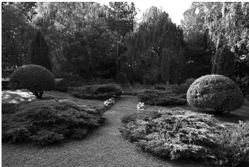
Rysunek 2. Zaczarowany ogród

Wyobraź sobie zaczarowany ogród i opisz go. Możesz posłużyć się poniższym zdjęciem (rysunek 2).