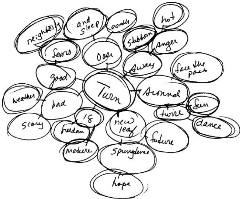
Rysunek 1. Sterowane skojarzenia 1

Weź kartkę A4, połóż ją poziomo na stole i napisz na środku, najlepiej w kółeczku, jakieś słowo, które wzbudza wiele skojarzeń, np. „słońce” albo „droga”, a następnie wypisz dookoła skojarzenia, które to słowo wywołuje, i połącz je strzałkami ze słowem początkowym. Od tych nowych słów poprowadź strzałki do kolejnych skojarzeń itd. Schemat może rozrastać się w nieskończoność. Na podstawie tych skojarzeń utwórz zdania, a następnie cały tekst. Podobnie jak w poprzednich metodach, także i w tym wypadku nie musisz dbać o zasady gramatyki i stylistyki, stwórz luźny tekst.